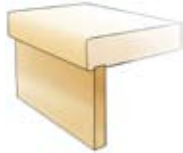
Sättsteg (vid tät trappa)