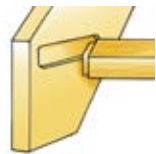
Steginfästning med tapp