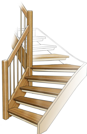
Sara 4.4.1 (Baseline 4)