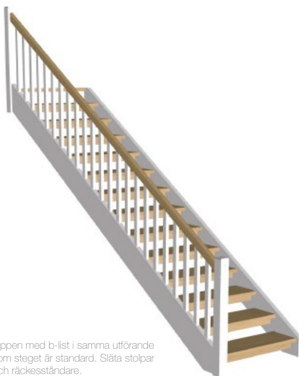
Öppen med b-list i samma utförande som steget är standard. Släta stolpar och räckesståndare.