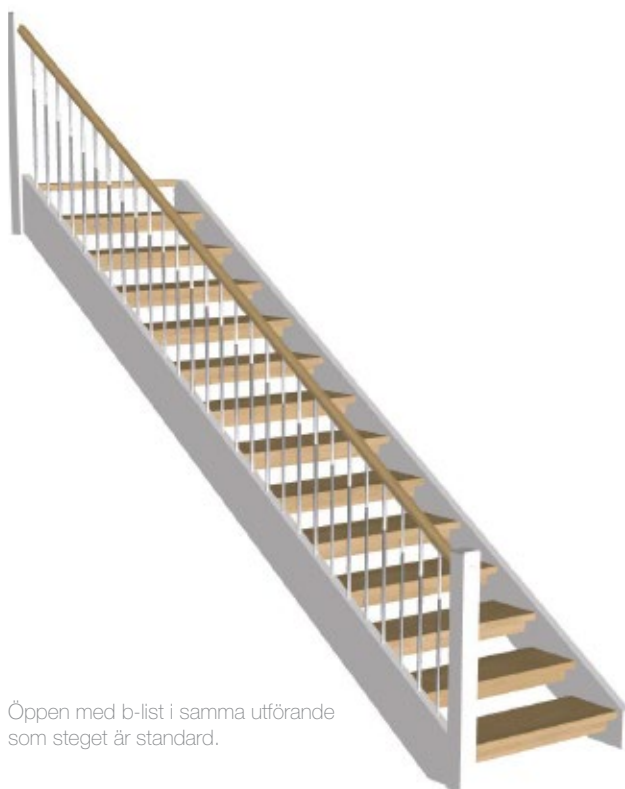
Öppen med b-list i samma utförande som steget är standard.