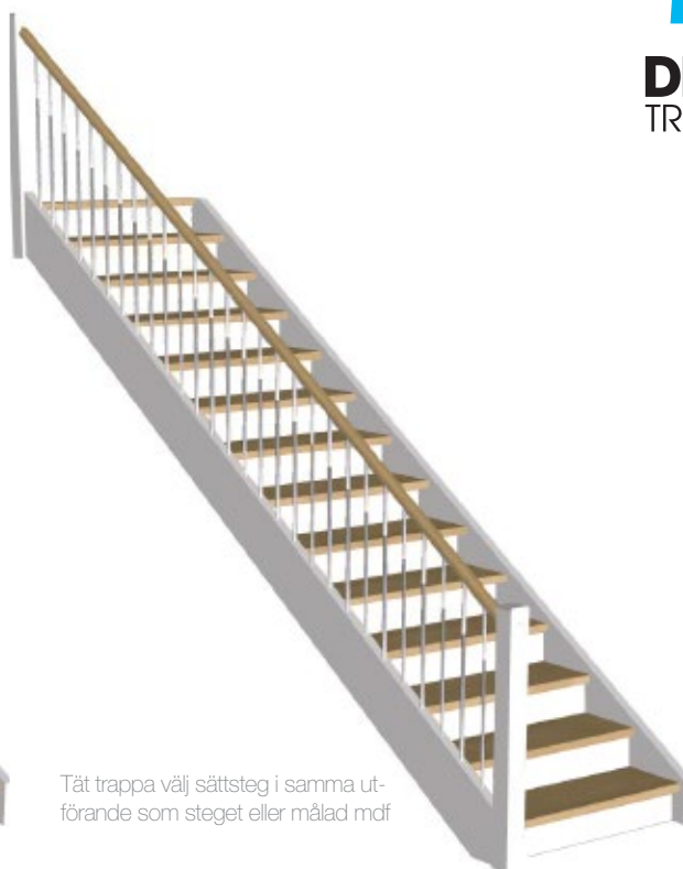
Tät trappa välj sättsteg i samma utförande som steget eller målad mdf