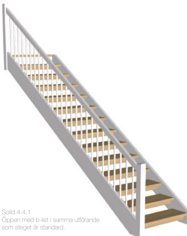
Solid 4.4.1 Öppen med b-list i samma utförande som steget är standard.