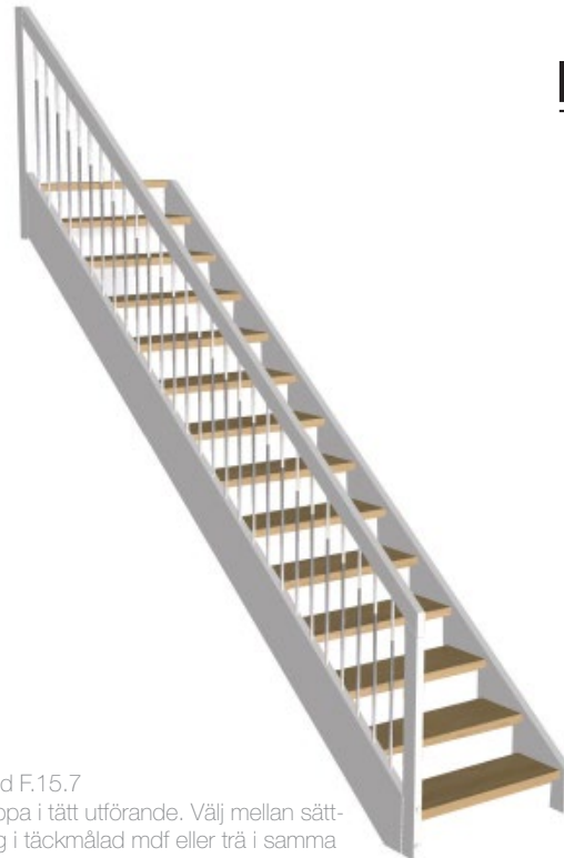
Solid F.15.7 Trappa i tätt utförande. Välj mellan sättsteg i täckmålad mdf eller trä i samma utförande som plansteg.