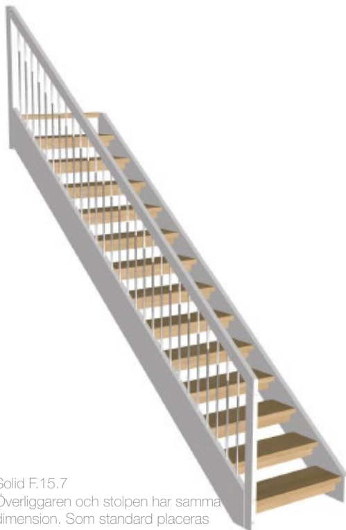
Solid F.15.7 Överliggaren och stolpen har samma dimension. Som standard placeras överliggaren på stolpen.