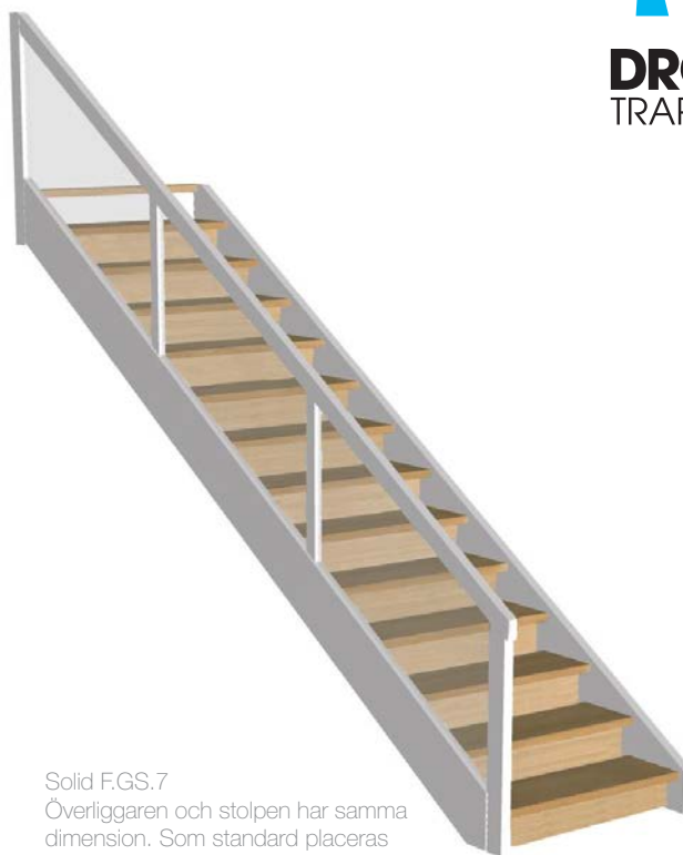
Solid F.GS.7 Överliggaren och stolpen har samma dimension. Som standard placeras överliggaren på stolpen.