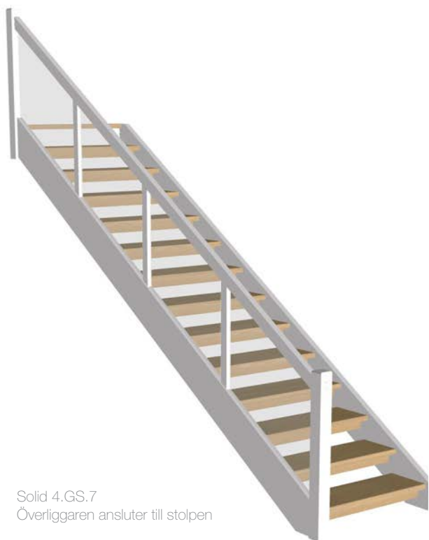
Solid 4.GS.7 Överliggaren ansluter till stolpen