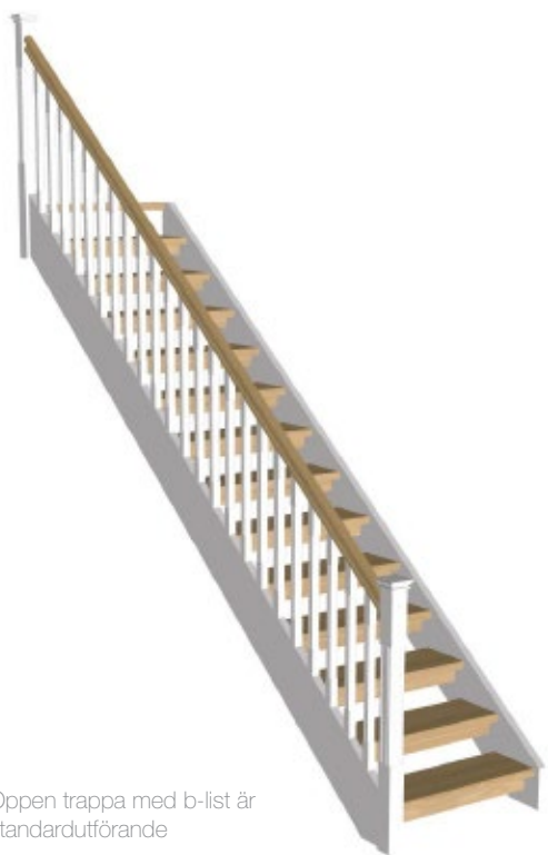
Öppen trappa med b-list är standardutförande