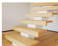
Öppen trapp med 40 mm framkantsprofil