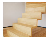
Tät trapp med nollöverlappning