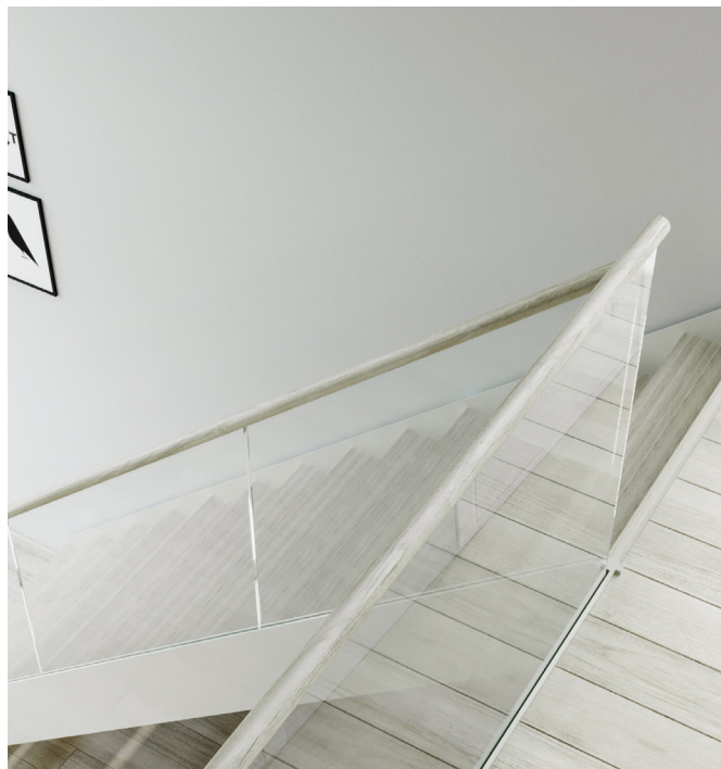
Modell med sidovangstycken i stål. Stegen monteras mellan vangstyckena.